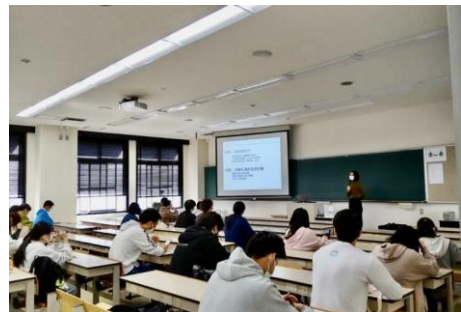
倉敷芸術科学大学での講義実施の様子（2022年）