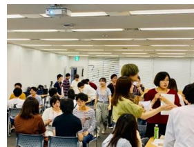
「en Career Creation Lab.」開催の様子 ※現在はコロナ感染予防対策の為オンラインにて開催