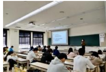
倉敷芸術科学大学での講義実施の様子(2022年)